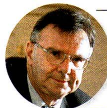
FRANCO FONTANA Sviluppo delle soft skill